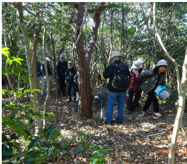
出丸の見学 眺望が少し改善