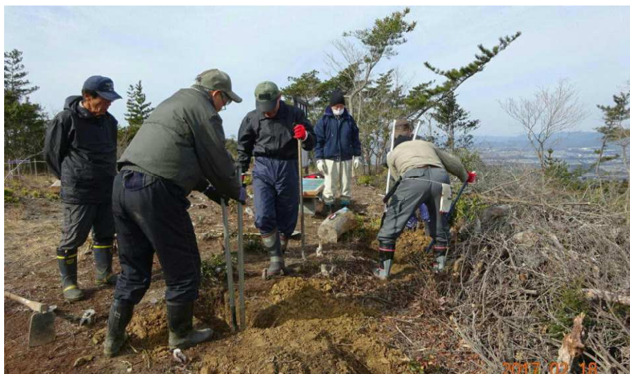
穴掘り作業は大変 深さ七〇cm