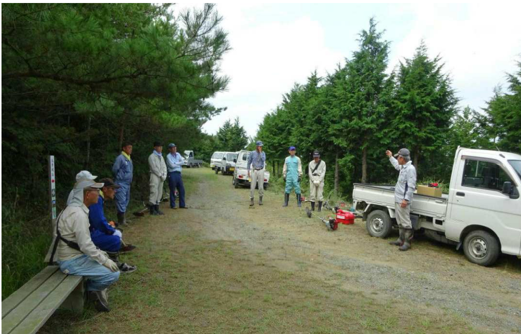
作業前の説明 12名が参加