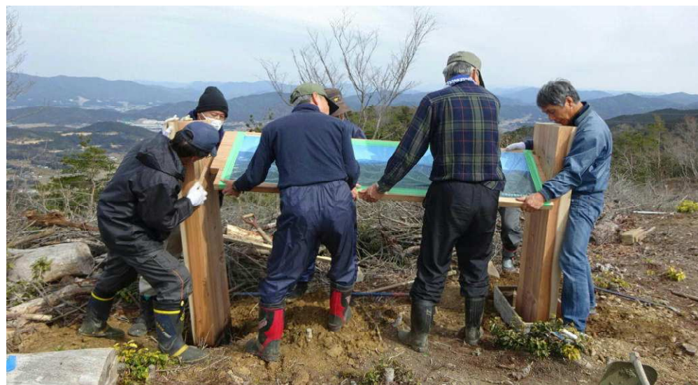
案内板の取り付け作業