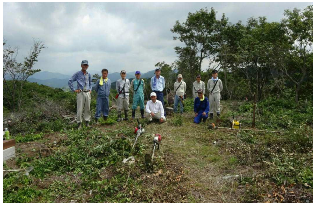
本丸跡と散策路，林道の草刈りを終えて