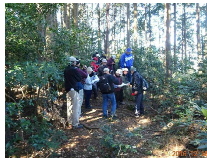
見ごたえのある高城砦