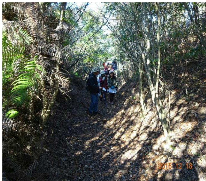
本丸下の横堀を見学