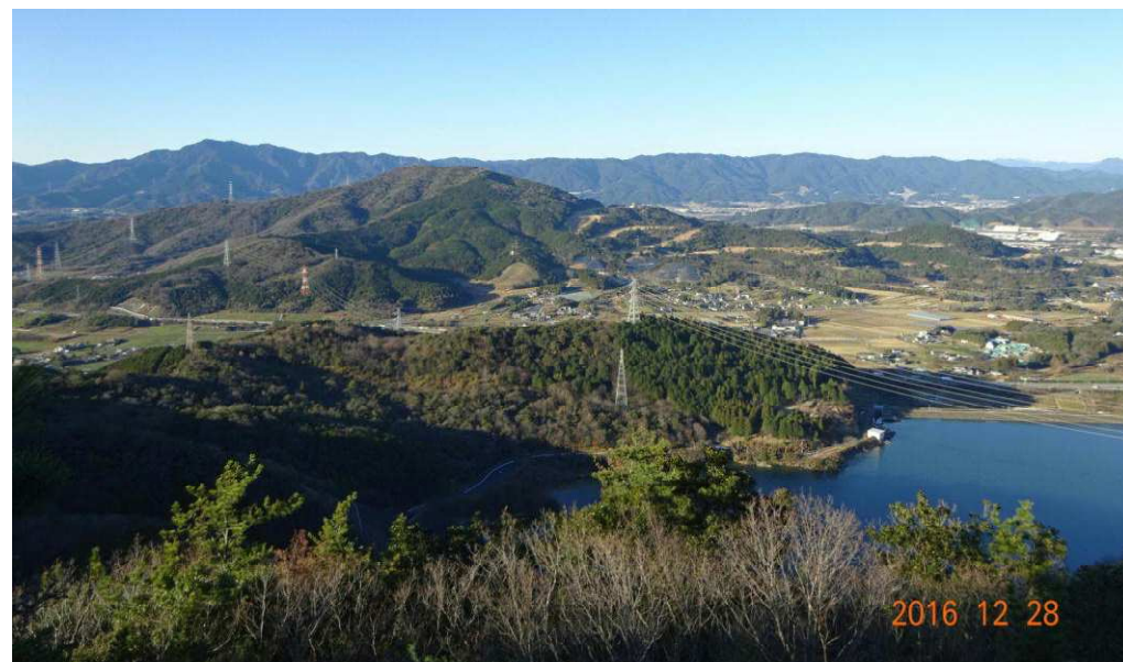
大原，吉祥山，本宮山，千郷方面