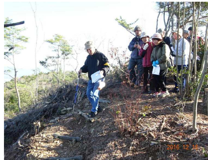
取り付けたばかりの階段が役立ちました